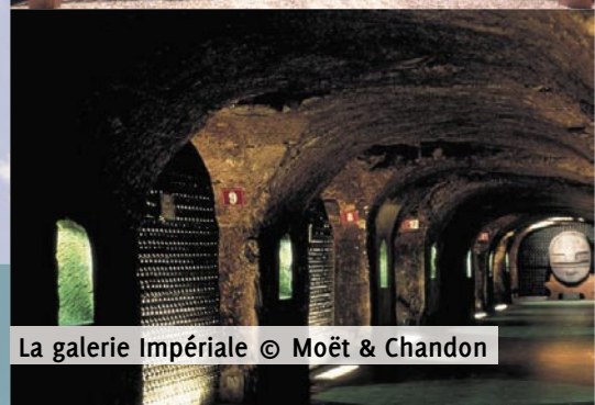
La galerie Impériale