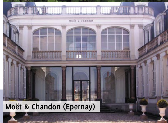
Moët & Chandon (Epernay)