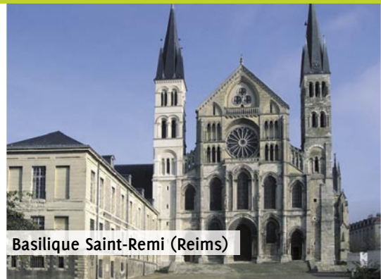
Basilique Saint-Remi (Reims)