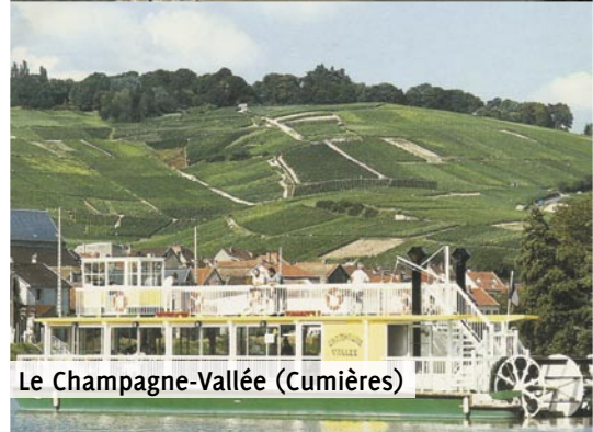
Le Champagne-Vallée (Cumières)